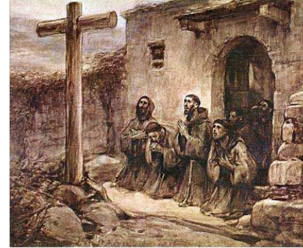
J. Benlliure: "Te adoramos... también en todas tus iglesias..."

Francisco fue un hombre oración, un hombre que en todo momento está contemplando a Dios, todo es locura de oración . Es necesario que los hombres y mujeres del siglo XXI seamos contemplativos, seamos capaces de envolver todas nuestras acciones con la oración. Hombres y mujeres que buscan el